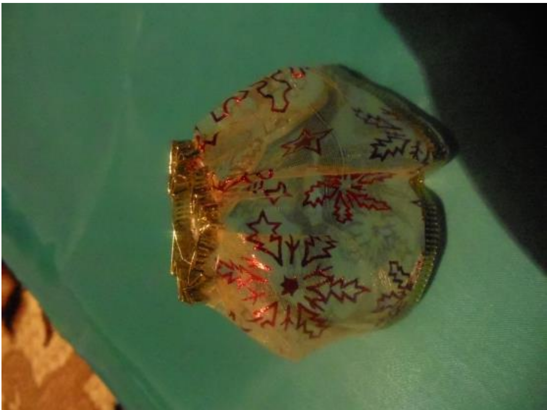
2 из ленты делаем крылья