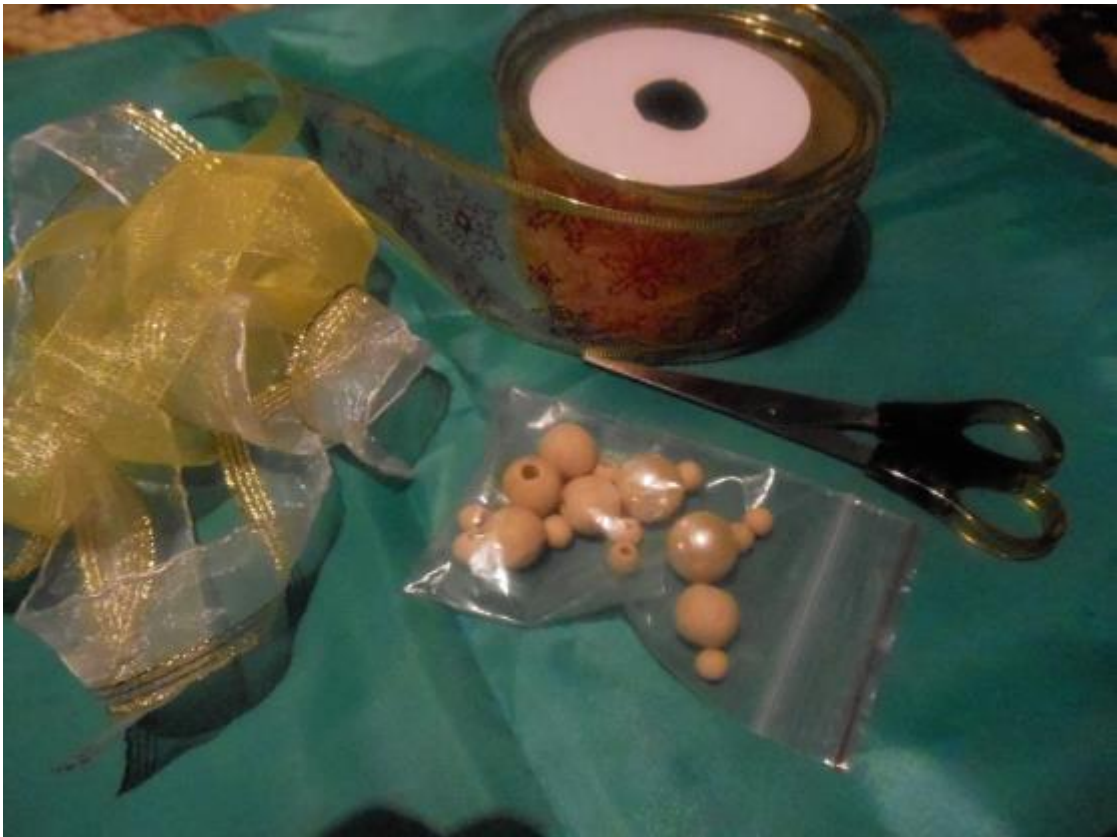
1 Делаем юбочку